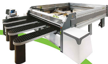
Biesse Setco táblafelosztó